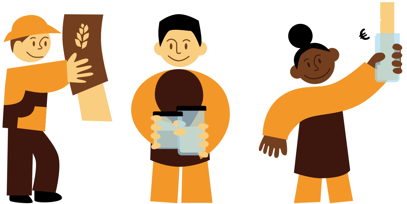
Personnages créés pour l'affiche