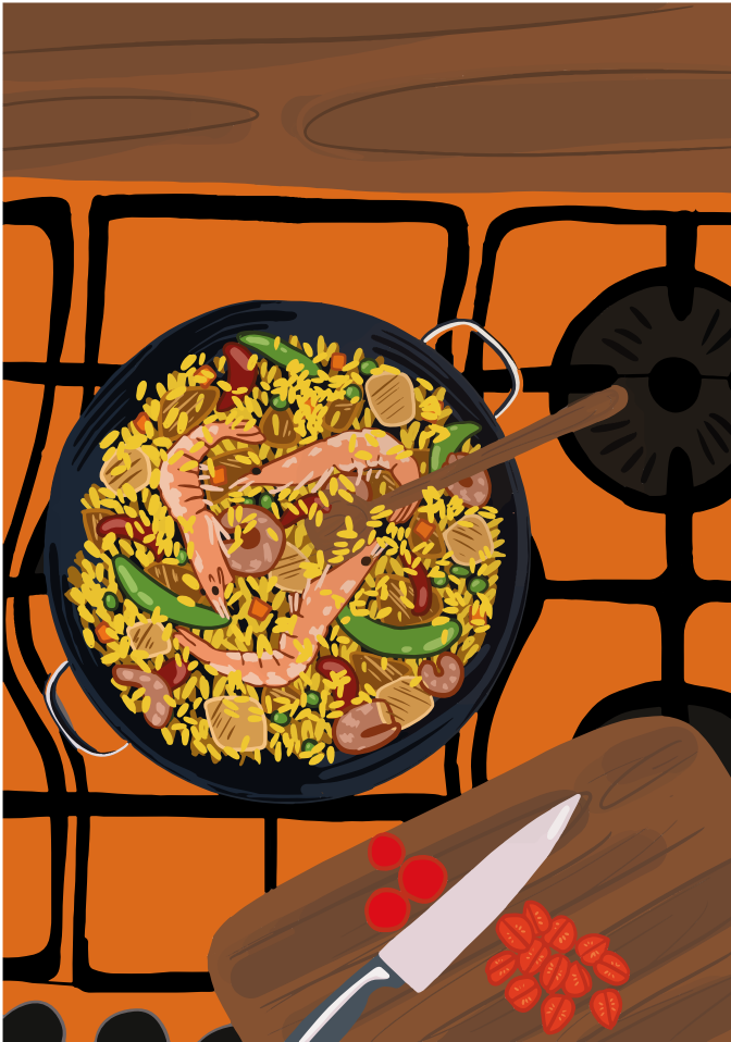
Illustration réalisée pour l'affiche