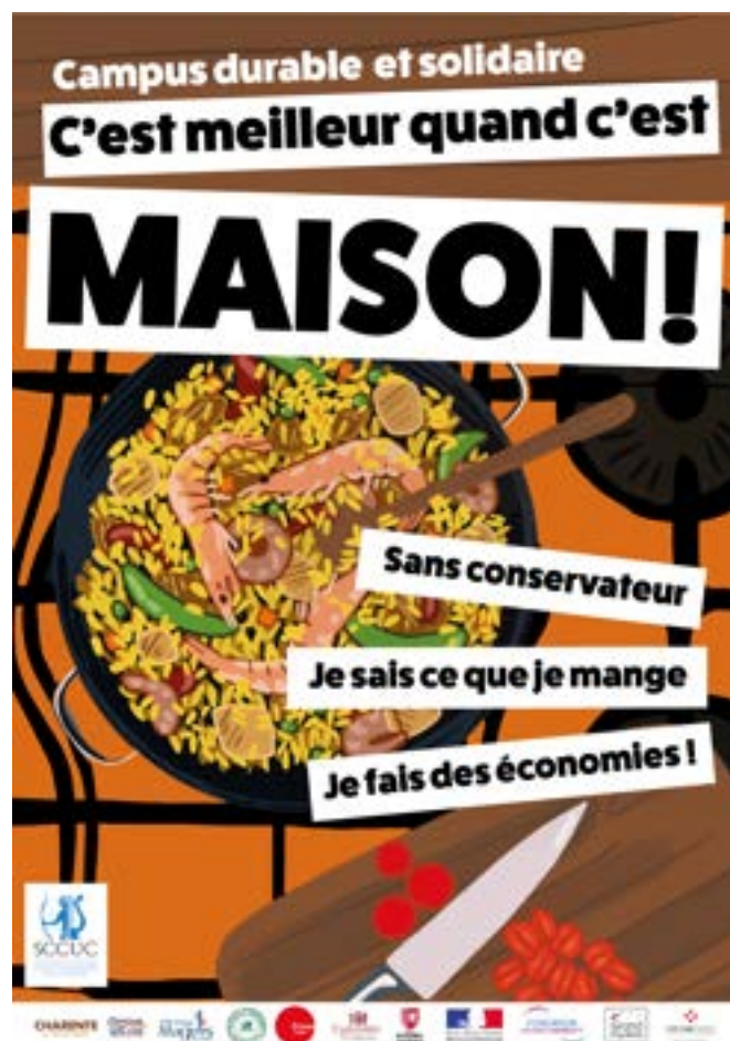
Affiche sur le « fait maison »

L'illustration visait à démontrer que cuisiner n'était pas aussi compliqué que cela pouvait paraître, et que les avantages valaient la peine d'être explorés. Elle soulignait également que cuisiner pouvait être un moment de détente et pourrait devenir le passe-temps favori des étudiants.