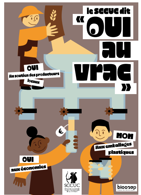
3 versions , 1 retenue