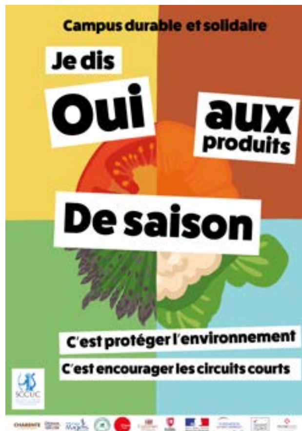
Affiche final pour les produits de saison

J'ai ensuite ajouté un slogan accrocheur en adoptant un point de vue personnel, afin que les étudiants se sentent concernés par cette action : "Je dis OUI aux produits de saison". J'ai également ajouté, suite à une suggestion de Marie-Line, de petites phrases pour expliquer les avantages de consommer des produits de saison.