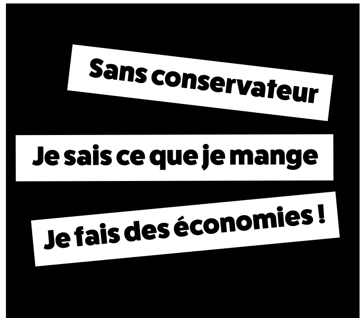
Text de l'affiche